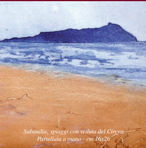
Sabaudia: spiagge con veduta del Circeo Pastellata a mano - cm 16x26