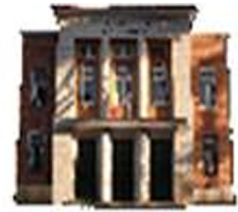
Associazione Vittorio Veneto