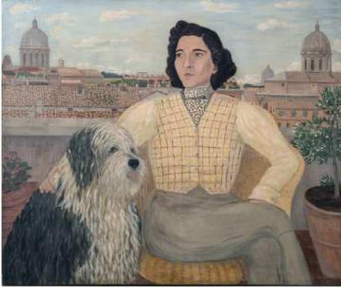
Autoritratto con cane sulla terrazza di Palazzo Caetani, 1939 olio su tela, cm 99,8x120 FCC 112