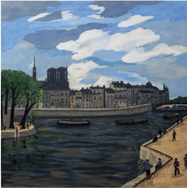
Parigi, 1934 Tempera su tela, cm 101x100 firmato e datato in basso a destra: Lelia Caetani 193 INV: FCC 42