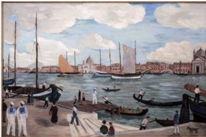
Venezia, 1934 olio su tela, cm 97x147 INV. FCC 140