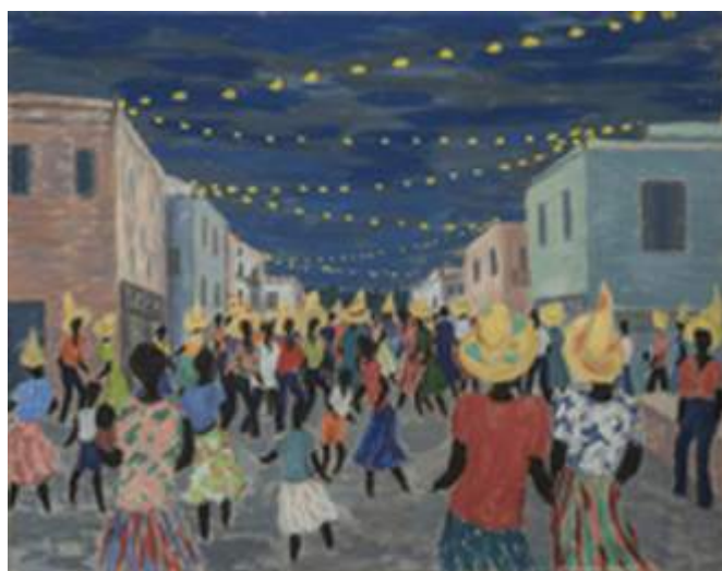
Festa in piazza. Antille inglesi, 1960-69,

Qui di seguito foto disponibili su richiesta in HD